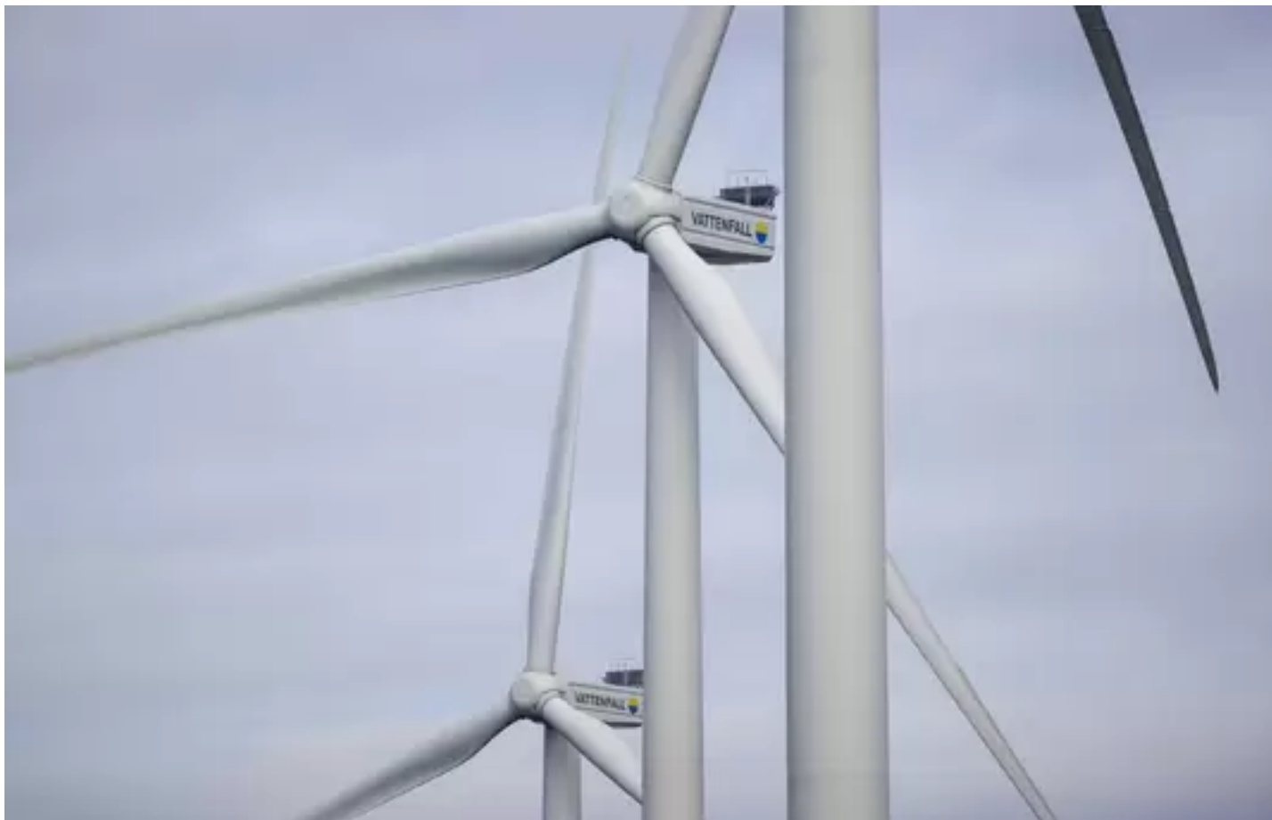
▲ Windmolens. Foto ter illustratie.

De gemeente laat in een reactie weten dat ze aan de start staat van een traject waarbij de inwoners, de gemeenteraad en wethouders met elkaar in gesprek gaan over windmolens in Vijfheerenlanden.