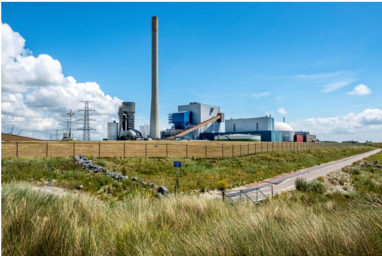
De Kerncentrale Borssele bij de gelijknamige plaats in Zeeland.

Een Kamermeerderheid vindt al enige tijd dat kernenergie als onderdeel van het nationale klimaatbeleid een serieuze kans moet krijgen. In september 2020 vroeg toenmalig VVD-fractievoorzitter Klaas Dijkhoff het kabinet deze optie nader te onderzoeken. Dijkhoffs motie werd gesteund door de complete rechtervleugel van het Kamergebouw (VVD, CDA, PVV, Forum voor Democratie, SGP en de eenmansfracties Van Haga en Krol). D66, ooit een verklaard tegenstander, zit op het vinkentouw en wijst kernenergie niet langer categorisch af.