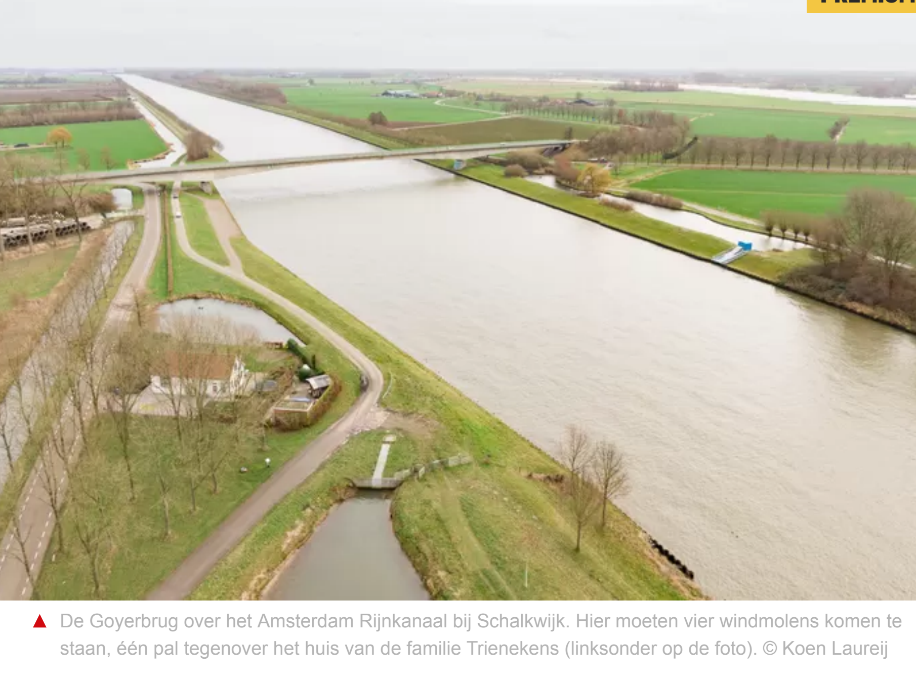
▲ De Goyerbrug over het Amsterdam Rijnkanaal bij Schalkwijk. Hier moeten vier windmolens komen te staan, één pal tegenover het huis van de familie Trienekens (links onder op de foto).