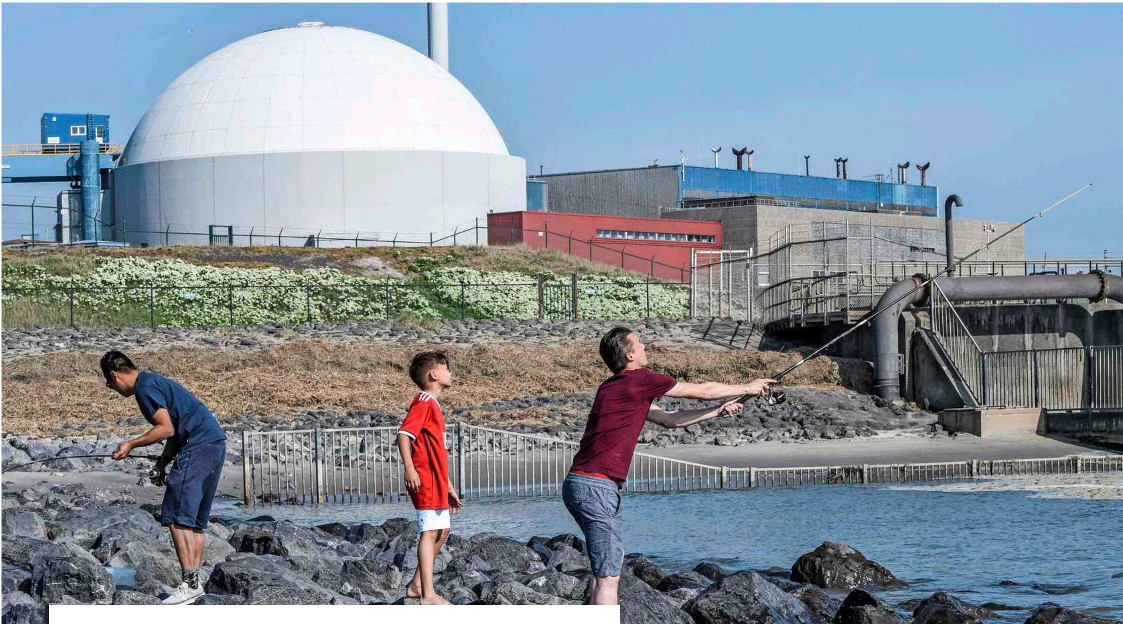
De kerncentrale van Borssele.

BRUSSEL - De wederopstanding van kernenergie krijgt steeds duidelijker vorm. Hoewel talloze milieuoactivisten kernsplitsing als energievorm jarenlang aan het kruis hebben genageld, is de wetenschappelijke dienst van de Europese Commissie helder over de voordelen van deze energievorm. Brussel lijkt de weg vrij te maken voor goedkope leningen voor de bouw van kerncentrales.