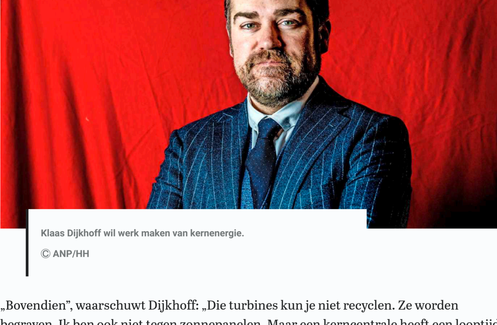
Klaas Dijkhoff wil werk maken van kernenergie.

„Ik ben niet tegen windmolens, maar er zit wel een grens aan”, zegt de VVD-fractie leider. „Wie kernenergie negeert, gaat eerst het hele land vol met turbines zetten tot over een grens van wat prettig is. En dan ben je er nog niet.”